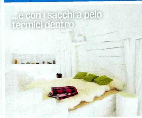
...e con i sacchi a pelo termici dentro

ACCOGLIENTE Sopra, lo chalet di neve dell'Hotel Lac Salin, a Livigno (So); a sin., l'interno. A ds., la campionessa di nuoto Federica Pellegrini, 29, a Livigno di recente per la sua prima lezione di sci. A ds., in alto, San Valentino romantico a Venezia. A ds., in basso, la modella Emily Ratajowski, 26, in gondola a Venezia.